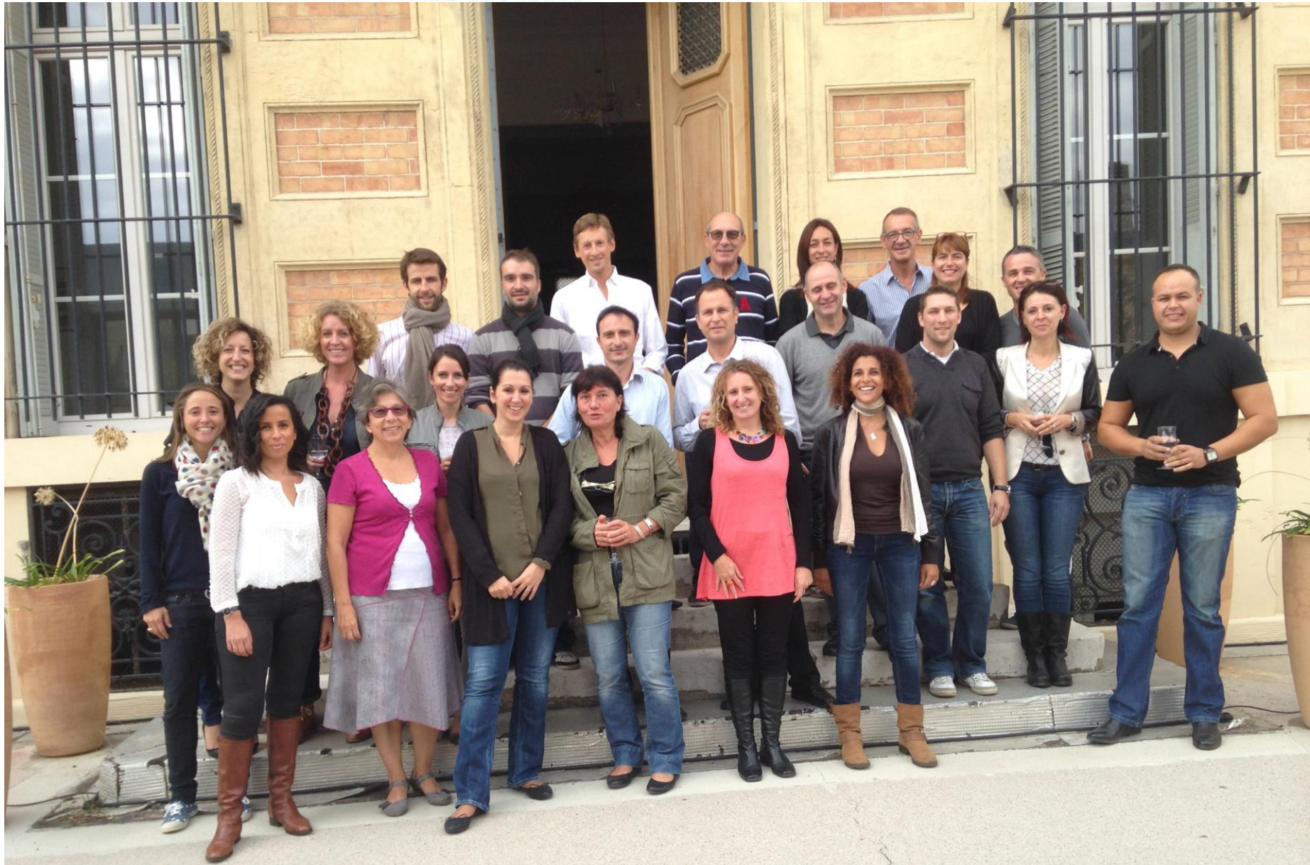
1 ère journée de formation des intervenants ENERGIE JEUNES le 19 octobre 2013 dans nos locaux de Marseille